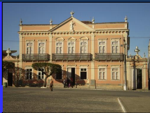
Foto da Casa de Cultura Carlos Chagas de Oliveira – MG – Foto site P.M. de Oliveira